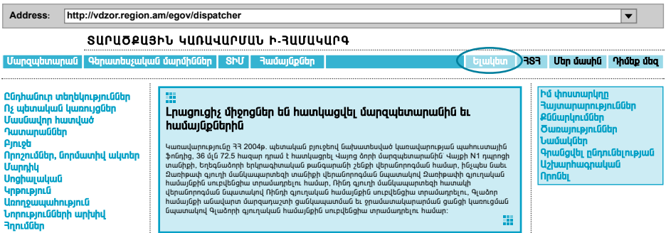
Նկար 18. «Ելակետ»

Էջի ներքևի շարքում գտնվում են «Նախարար» և Հայաստանի մնացած այլ մարզերի անունները: «Նախարար» անվանման վրա սեղմելիս բացվում է Հայաստանի Տարածքային Կառավարման ի-Համակարգի վեպ կայքը, իսկ մարզերի անվանումների վրա սեղմելիս բացվում է համապատասխան մարզի Տարածքային կառավարման ի-Համակարգի վեպ կայքը: