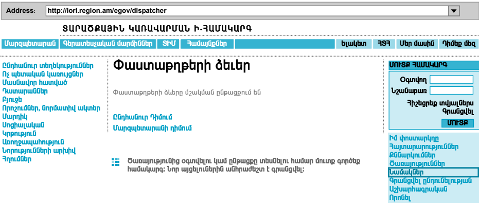
Նկար 26. «Նամակներ»

V. «Նամակներ» անվանման վրա սեղմելիս բացվում է «Փաստաթղթերի ձևեր» էջը (տես նկար 26), այնտեղ ներկայացված են տարաբնույթ դիմումների ձևեր: Ծառայությունից օգտվելու կամ ընթացքը տեսնելու համար անհրաժեշտ է մուտք գործել համակարգ, իսկ նոր այցելուներին անհրաժեշտ է գրանցվել: Համապատասխան դիմումի անվանման վրա սեղմելիս բացվում է տվյալ դիմումի էջը: Անհրաժեշտ վանդակները լրացնելիս սեղմելով «Տպվող տարբերակը» կոճակը կարող եք տեսնել դիմումն ամբողջությամբ: Սեղմելով «Վերադառնալ» կոճակին կվերադառնաք նախորդ էջը: Սեղմելով «Ցուցադրել» կոճակը կարող եք տեսնել դիմումը: Սեղմելով «Ներկայացնել» կոճակը կվերադառնաք «Նամակներ» էջը, որտեղ «Ներկայացված փաստաթղթեր» բաժնում կարող եք տեսնել ձեր կողմից ներկայացված դիմումների կարգավիճակը: Դիմումի պատասխանի առկայության դեպքում անհրաժեշտ է սեղմել «Պատասխանը» կոճակը: