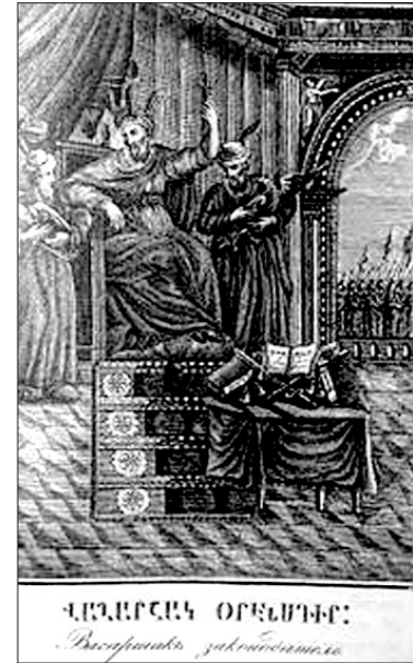
ընկնվել են համաքաղաքային դատարաններում:

նեցել են խայտաբղետ բնակչություն (հատկապես մեծ է եղել հրեաների թիվը): Զաղաքային բնակչության էթնիկական - կրոնական տարբեր խմբերն ապրել են առանձին համայնքներով՝ քաղաքի առանձին թաղամասերում, որոնք ունեցել են իրենց ներքին վարչական մարմինները, դատարանները եւ մշակութային, կրոնական հիմնարկները: Քրեական ծանր հանցագործությունները եւ տարբեր համայնքների անդամների միջեւ առաջացած դատական գործե-