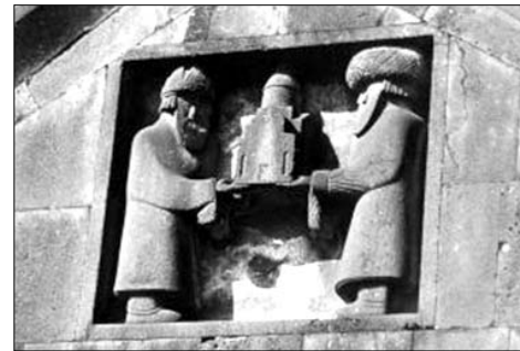
Գուրգեն եւ Սմբատ Բագրատունիների հարթաքանդակը Հաղպատի վանքի պատին

Հարցի պատասխանը գտնում ենք 11-13-րդ դարերի աղբյուրներում: Պարզվում է, որ քաղաքներն ունեին ամբողջ քաղաքի եւ նրա բնակչությանը վերաբերող առավել կարեւոր հարցերը տնօրինող խորհուրդ, որը բաղկացած էր քաղաքի մեծամեծերից: 1045թ., երբ Կոստանդին Մոնոմախ կայսրը խաբեությունը Գագիկ Բ-ին իր մոտ կանչեց եւ կալանավորեց Կոստանդնու-