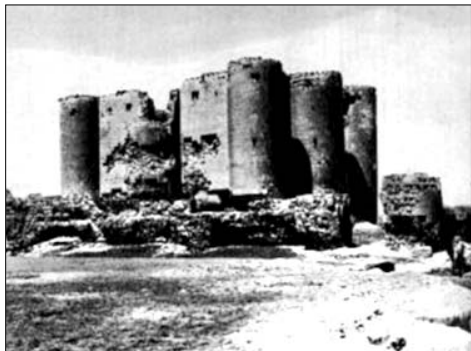
Բագրատունիների օրոք կառուցված Տիգրանի ամրոցը (IX դար, Գյումրի-Կարս ճանապարհին)

քային վերնախավի շարքերը: Շատ ավելի բազմամարդ էին քաղաքի ստորին խավերը, որոնք բաղկացած էին արհեստավորներից, մանր առեւտրականներից, քաղաքի երկրագործ բնակչությունից, ծառաներից, փախստական ճորտերից, քաղաքային «ամբոխից»: Քաղաքի ստորին խավերի աճը տեղի էր ունենում ավելի արագ եւ առավել մեծ չափերով: