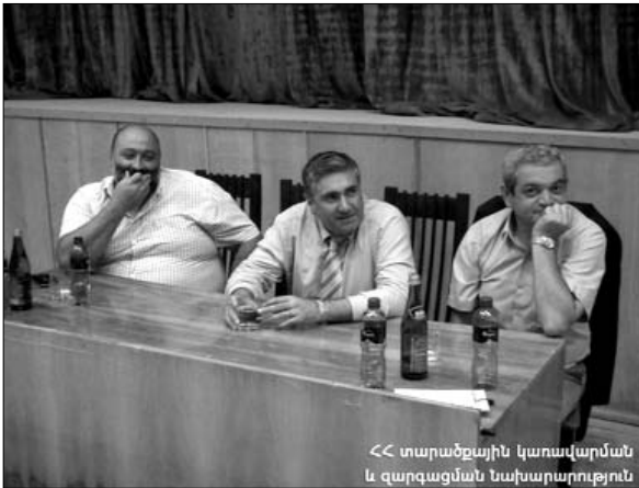
«Մարաթոնային կառավարման և զարգացման նախարարություն»

Օգոստոսի 7-8-ը Շիրակի մարզի Ամասիա եւ Աշոցք խոշորացված համայնքների ներկայացուցիչների համար անցկացվել են վերապատրաստման դասընթացներ «Ծրագրերի կազմում եւ լրացուցիչ ֆինանսական միջոցների ներգրավում» թեմայով: