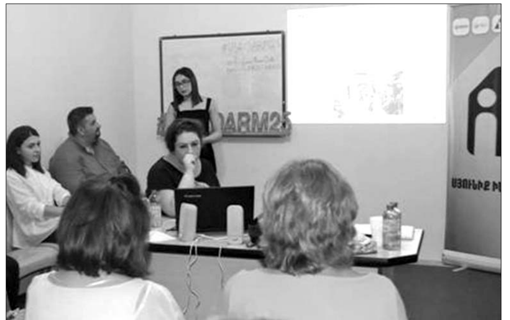
Համայնքային ակտիվ խմբերը նիստի օրակարգում հարց ընդգրկելու հանդես են եկել համայնքի ավագանու նախաձեռնությամբ: