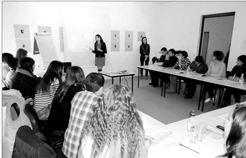
«ԿԱՍԸ» Լոռվա երիտասարդական ծրագրերի կենտրոնը պարբերաբար կազմակերպում է համայնքային կյանքին երիտասարդների մասնակցայնությունը խթանող ծրագրեր

• Փարաքար համայնքի բնակիչների, հատկապես՝ երիտասարդների շրջանում կբարձրանա մասնակցային կառավարման վերաբերյալ իրազեկվածության մակարդակը, ինչին կնպաստեն