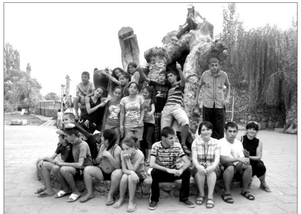
«Հուլիսի Մեծամոր» հաշմանդամների հիմնահարցերով զբաղվող ՀԿ-ն պարբերաբար իրականացնում է ծրագրեր՝ համայնքի երեխաների համար:

Ծրագրի նպատակն է նպաստել ծրագրի շահառու Փարաքար համայնքում քաղաքացիների ակտիվ և իրազեկ մասնակցությանը տեղական ինքնակառավարմանը՝ համայնքի բնակիչների, հատկապես՝ երիտասարդների շրջանում մասնակցային կառավարման վերաբերյալ իրազեկվածության մակարդակի բարձրացման, նրանց կողմից համայնքային խնդիրների բարձրաձայնման և հանրային նախաձեռնությունների իրականացման միջոցով: Ծրագիրը նպատակ ունի նաև համայնքում այլընտրանքային ՉԼՄ-ների զարգացման միջոցով նպաստել տեղական ինքնակառավարման վերահսկողությանը, ՏԻՄ-համայնքի բնակչություն հարողակցման որակի բարելավմանը: