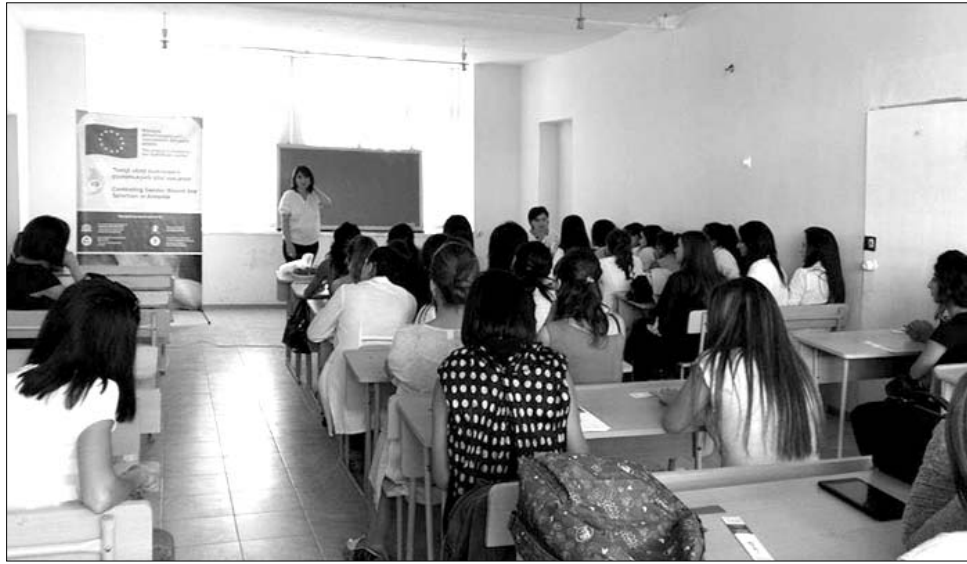
«Հուլիսի Մեծամոր» ՀԿ-ն ակտիվ է համայնքային նշանակության շատ ծրագրերում: