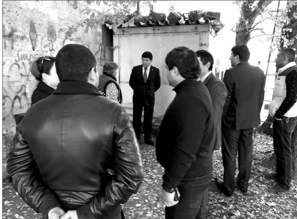
պատճառ են դառնում: Էկոլոգիական այս խնդրի վերաբերյալ տեղյակ են համապատասխան գերատեսչությունները, եւ հույս ունենք՝ որ որոշ ժամանակ անց այն կլուծվի:

Համայնքը դեռեւս ունի ոռոգման ջրի, կոյուղագծերի խնդիր, հրատապ է նաեւ վթարային շենքերի ամրացման հարցը: Մասիս քաղաքի հարեւանությամբ գտնվում է բավական մեծ աղբավայր, որտեղից տարածվող հոտերը, ծուխը բնակչության արդարացի դժգոհության