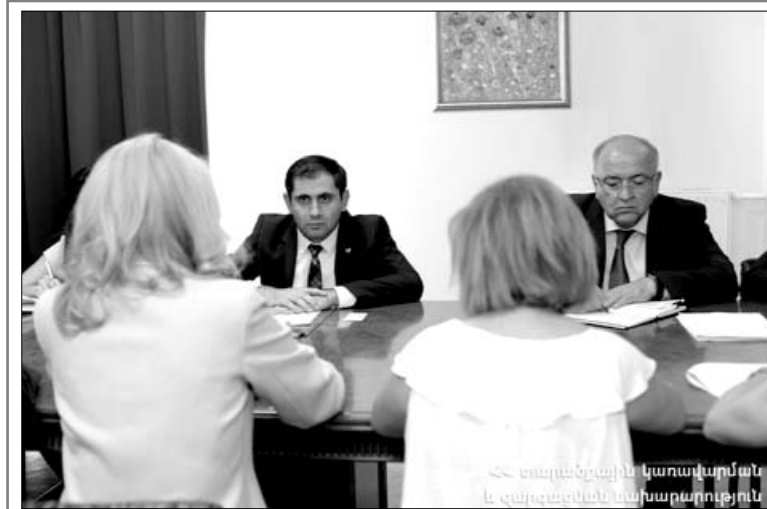
«Մարդամեջի կառավարման և զարգացման նախարարություն»