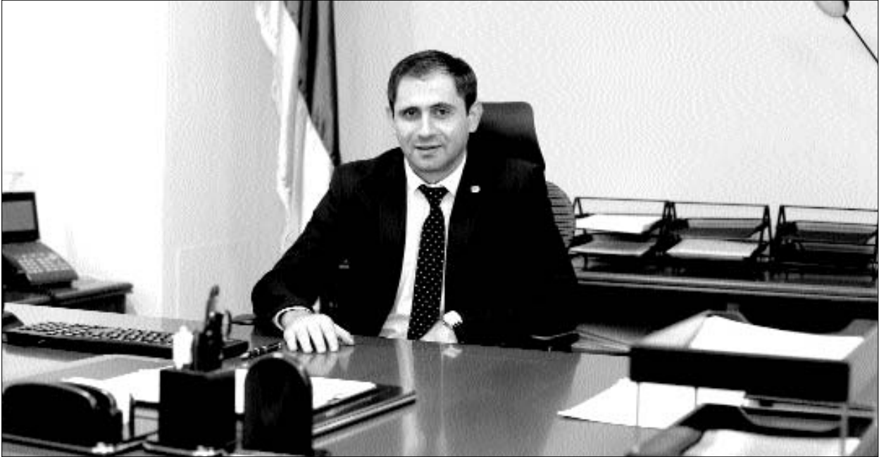
«Համայնք-ՀամաՏեղի» գրուցակիցն է ՀՀ տարածքային կառավարման և զարգացման նախարար Սուրեն Պապիկյանը:

Համայնքների միավորման գործընթացը շարունակական է լինելու