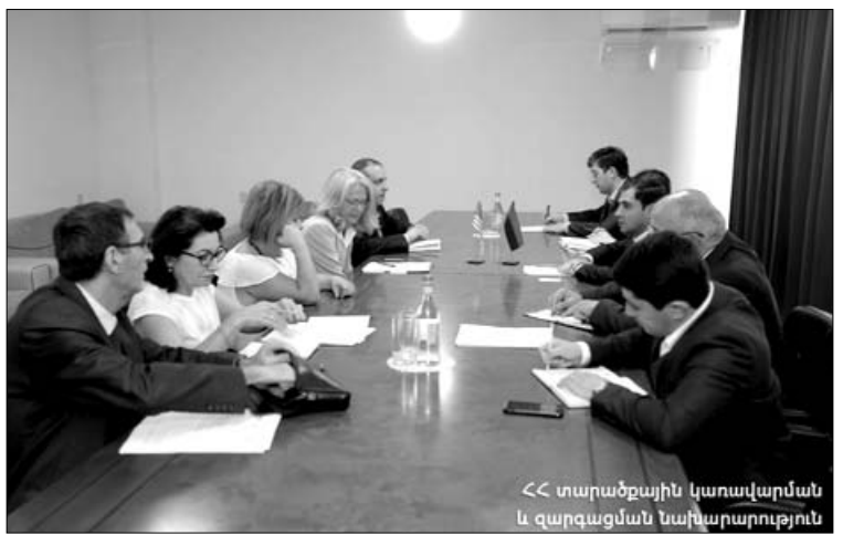
«Մարդամեջի կառավարման և զարգացման նախարարություն»

Հանդիպման ընթացքում կողմերը քննարկել են նաեւ տեղական ինքնակառավարման կարողությունների ընդլայնմանը, վարչական լիազորությունների պատվիրակմանը, համայնքներում մասնակցային արդյունավետ ու հաշվետու կառավարմանը, ինչպես նաեւ ապակենտրոնացման ճանապարհային քարտեզի առանձին բաղադրիչներին վերաբերող հարցեր: