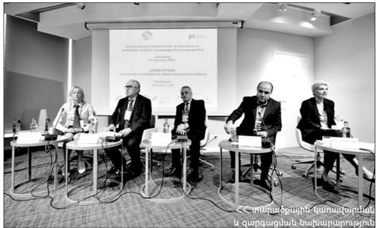
«Մարաթոնային կառավարման և զարգացման նախարարություն»

պետարանում եւ նպաստում է մատուցվող ծառայությունների վրա ծախսվող ժամանակի կրճատմանը: Այն կապահովի համայնքային ծառայությունների մատուցումը «լավ կառավարման» սկզբունքների համաձայն: Համակարգի միջոցով հնարավոր է բնակիչներին մատուցել առցանց ծառայություններ, հետեւել դիմումների եւ գրությունների ընթացքին, իսկ հարցերի դեպքում՝ առցանց դիմել համապատասխան մասնագետներին: Վարչատարածքային բարեփոխումների շրջանակում ՀԿՏՀ-ն ապահովում է վարչական ծառայությունների մատուցում բնակիչներին անմիջապես բնակավայրերում, խոշորացված համայնքի արդյունավետ կառավարում, բնակավայրերի ինտեգրում եւ փոխգործակցություն մեկ միասնական տեղեկատվական միջավայրում: «Լավ տեղական ինքնակառավարում Հարավային Կովկասում» ծրագրի շրջանակներում հիմնվել են 35 քաղաքացիների սպասարկման գրասենյակներ Հայաստանի 8 մարզերում: Առաջիկա երկու ամիսների ընթացքում շահագործման կհանձնվեն եւս 5 գրասենյակներ: Այսպիսով, մինչ տարվեք Երեւանից դուրս բնակվող բնակչության գրեթե 40 տոկոսը հնարավորություն կունենա օգտվելու ՀՀ համայնքապետարանների կողմից մատուցվող որակյալ ծառայություններից: