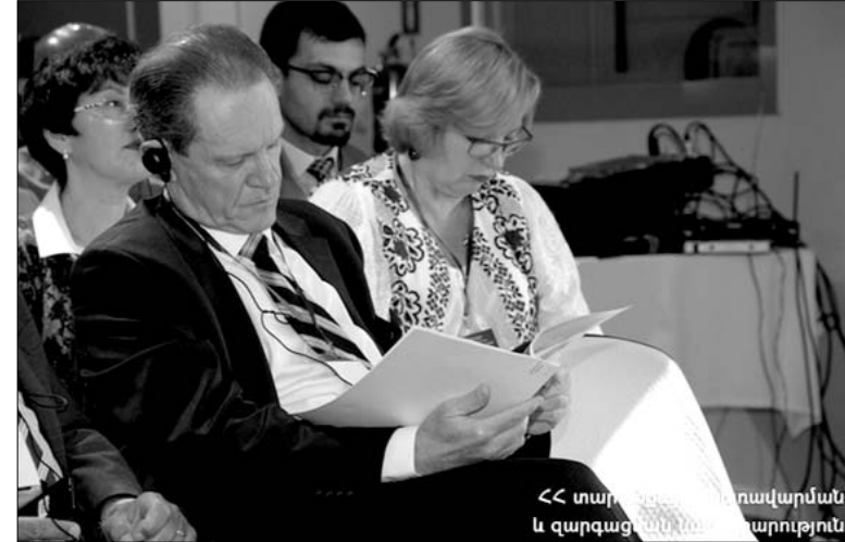
«Մարաթոնային կառավարման և զարգացման նախարարություն»

համայնքապետարաններում իրականացվող վարչական գործընթացները: Հայաստանում քաղաքացիների սպասարկման գրասենյակներում աշխատանքներն իրականացվում են Համայնքային կառավարման տեղեկատվական համակարգի (ՀԿՏՀ) կիրառմամբ, որը որպես ՏԻՄ-երի համար մշակված տեղեկատվական համակարգ՝ թույլ է տալիս ապահովել տեղեկատվական հոսքերի ավտոմատացված կառավարում համայնքա-