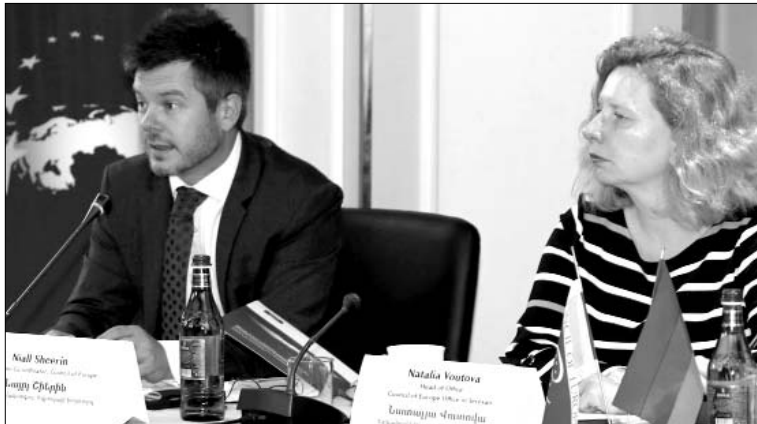
Եւ գործիքակազմի կիրառումը համայնքներում

Եվրոպայի Խորհրդի Հայաստանի համար իրականացվող գործողությունների 2015-2018թթ. ծրագրի համատեքստում կազմակերպված «Ազակցությունը Հայաստանում տեղական ժողովրդավարության ամրապնդմանը» ծրագիրը նպատակ ունի ամրապնդել տեղական ժողովրդավարությունը եւ աջակցել ապակենտրոնացմանը Հայաստանում: Ծրագրով աջակցություն է տրամադրվում ՀՀ կառավարությանը՝ բարելավելու տեղական ինքնակառավարման իրավական եւ ինստիտուցիոնալ շրջանակները եվրոպական ստանդարտներին եւ գործիքներին համապատասխան: Հայաստանի համայնքները իրենց հերթին կօգտվեն այն կարողությունների զարգացման ամուսնով, որոնք նպատակաուղղված կլինեն նրանց միջին փոխգործակցությունն ամրապնդելուն եւ քաղաքացիներին ավելի արդյունավետ ծառայություններ մատուցելուն: